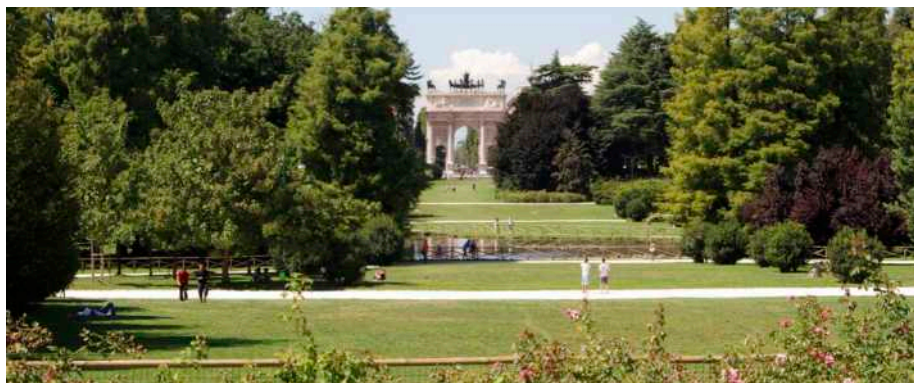
L'ampia varietà di specie arboree presenti nel Parco Sempione