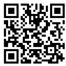
Il sentiero GPX